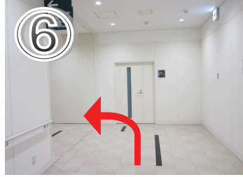
⑥1つ目の角を左へ曲がってください。