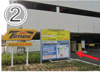
②「タイムズ ウェルネージ かこがわ」駐車場入口です。