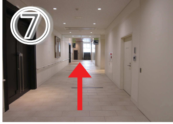
⑦まっすぐ進んでください。