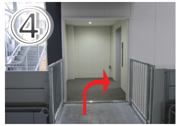
④エレベーターで1階へお進みください。