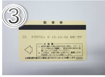
③駐車券は必ず健診会場へお持ちください。割引処理を致します。