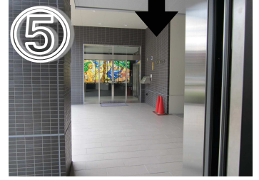
⑤正面に入口があります。中にお進みください。