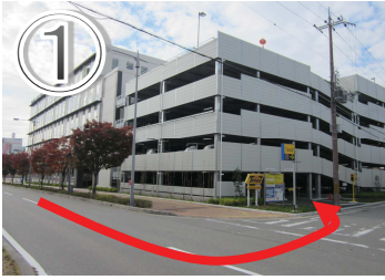
①ウェルネージ（保健センター）の駐車場です。