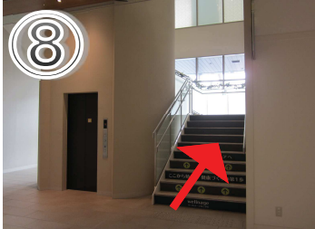
⑧健診会場は2階です。階段またはエレベーターをご利用ください。