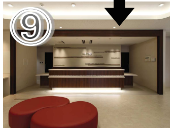
⑨正面が健診受付です。