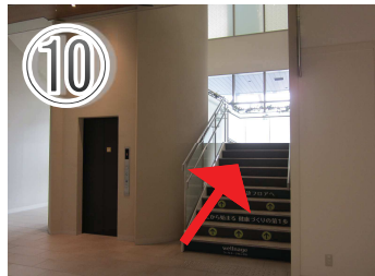
⑩健診会場は2階です。階段またはエレベーターをご利用ください。