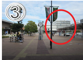
③ 駅を出ると斜め右に「ウェルネージ」の白い建物が見えます。