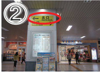
②左手（北口）に進んでください。