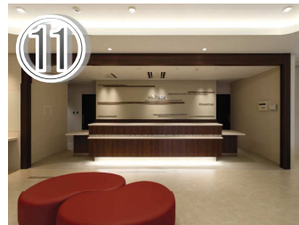
⑪正面が健診受付です。