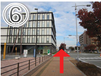
⑥直進してください。