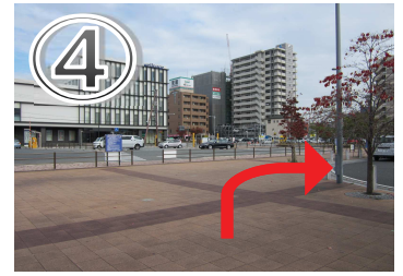
④ロータリーを道なりに右方向へ進んでください。