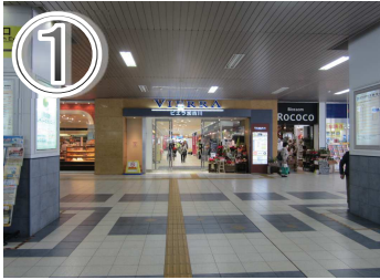
① JR加古川駅の改札を出たところです。徒歩約3分です。