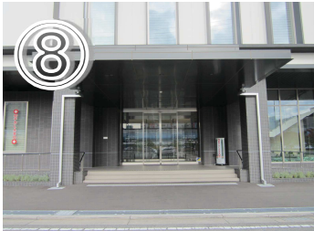
⑧「ウェルネージ」の正面玄関です。